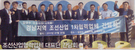
조선산업협력업체 대표단 간담회