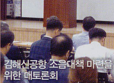
김해신공항 소음대책 마련을 위한 태도론회