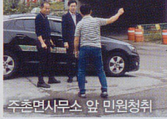
주천면사무소 앞 민원청취