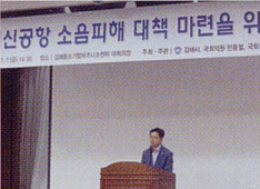
신항양 소음피해 대책 마련을 위