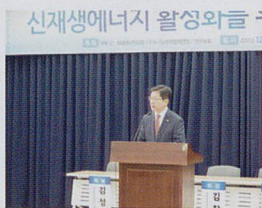
신재생에너지 활성화를 위한 혁신 방안 모색 정책토론회