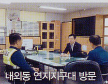
내외동 연지지구대 방문