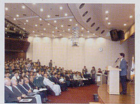
가야사 복원 관련 토론회