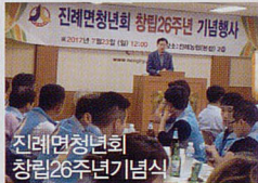
진례연청년회 창립26주년 기념식