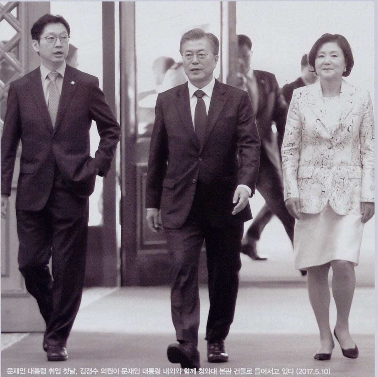
문재인 대통령 취임 첫날, 김경수 의원이 문재인 대통령 내외와 함께 청와대 본관 건물로 들어서고 있다 (2017.5.10)