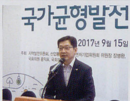
국가균형발전특별법 개정안 공청회