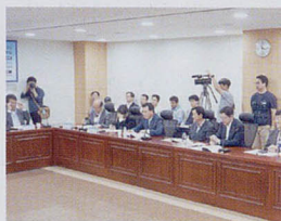
공공기관의 사회적 가치 실현을 위한 토론회