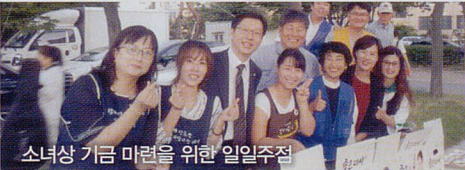
소년상 기금 마련을 위한 일일주점