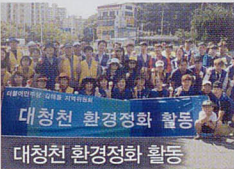
대청천 환경정화 활동