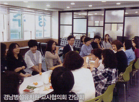
경남형설치지원 교사협의회 간담회