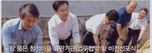
도량 품은 청정마을 유관기관 업무협약 및 비전선포식